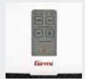
2 funzioni: sigilla e sottovuoto

Easy to use, compact and silent, It seals in few seconds and vacuums a large variety of foods, to keep them fresh up to five times longer.