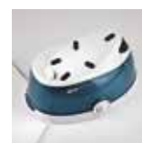
Con caldaia in acciaio inox