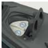
Filtro anti calcare intercambiabile

EFFICIENT AND CONVENIENT: UNLIMITED IRONING CAPACITY WITH STATION'S INNOVATIVE CONTINUOUS REFILL SYSTEM!