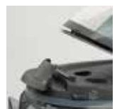
Sistema di blocco ferro