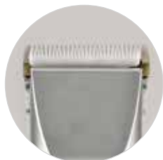
Lama di taglio in ceramica.