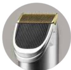
Lama fissa rivestita in titanio.