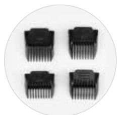
4 pettini di taglio: 3 - 6 - 9 - 12 mm

Lama di taglio in ceramica e lama fissa rivestita in titanio, per un taglio preciso e perfetto.